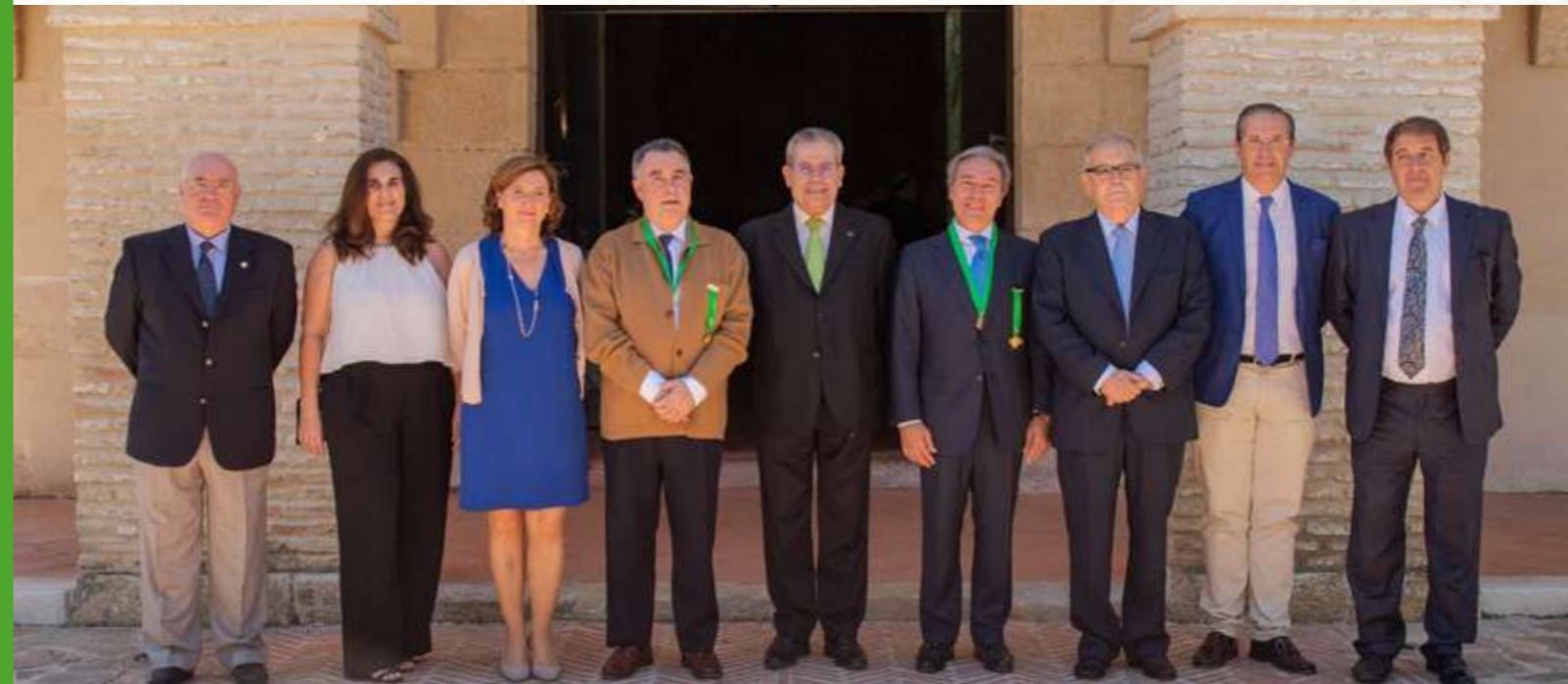
REPRESENTANTES DEL COLEGIO DE GESTORES ADMINISTRATIVOS GRANADA, JAÉN Y ALMERÍA