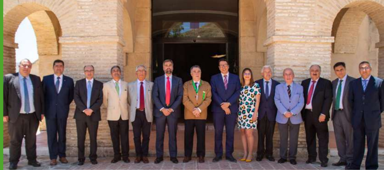
REPRESENTANTES DEL COLEGIO DE GESTORES ADMINISTRATIVOS SEVILLA, CÁDIZ, CÓRDOBA Y HUELVA