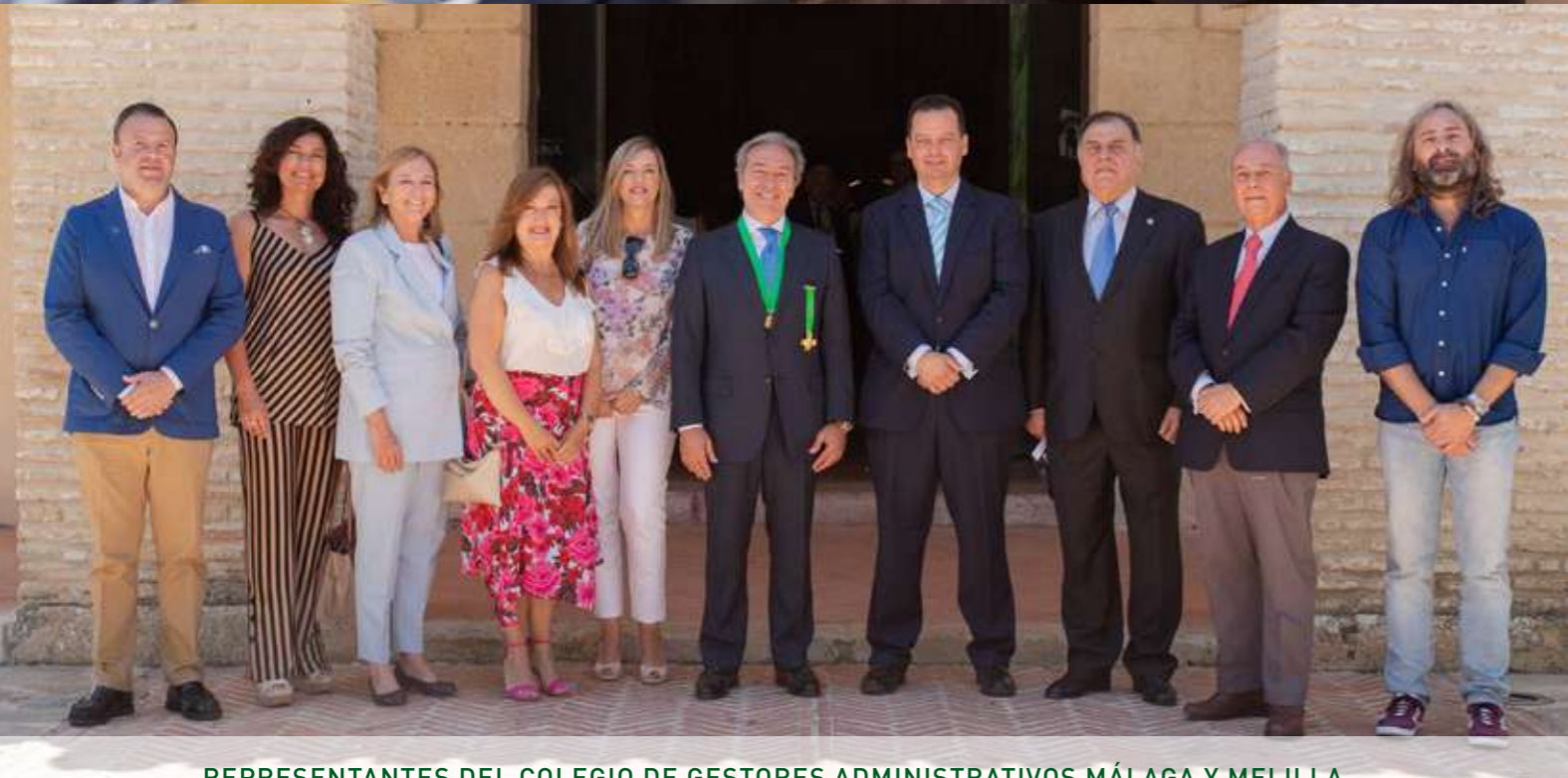
REPRESENTANTES DEL COLEGIO DE GESTORES ADMINISTRATIVOS MÁLAGA Y MELILLA